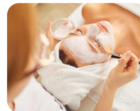
Limpeza de Pele.